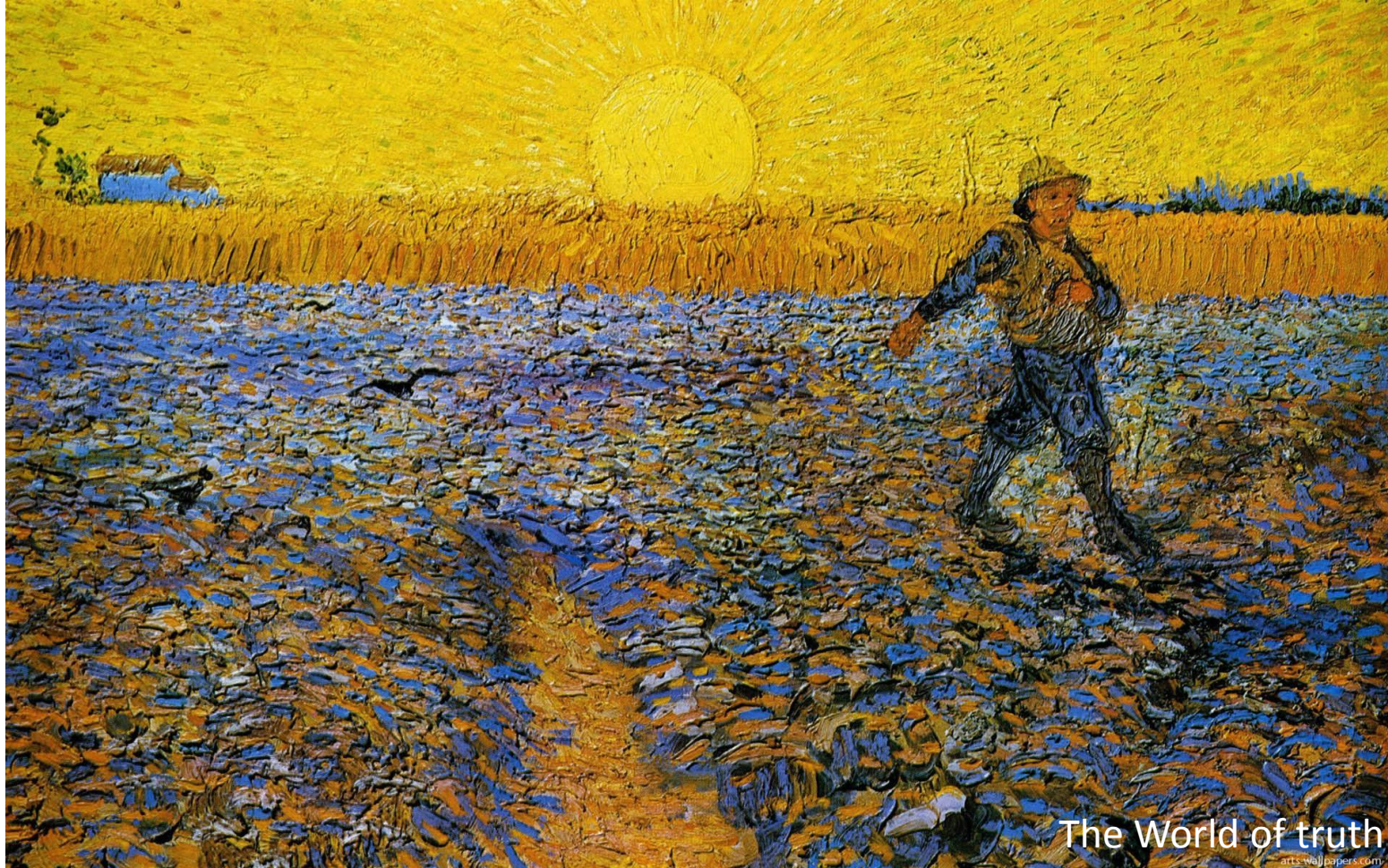
The World of truth arts.wallpapers.com

YAKIN DOĐU ÜNİVERSİTESİ DENEYSEL SAĐLIK BİLİMLERİ ARAŐTIRMA MERKEZİ DESAM